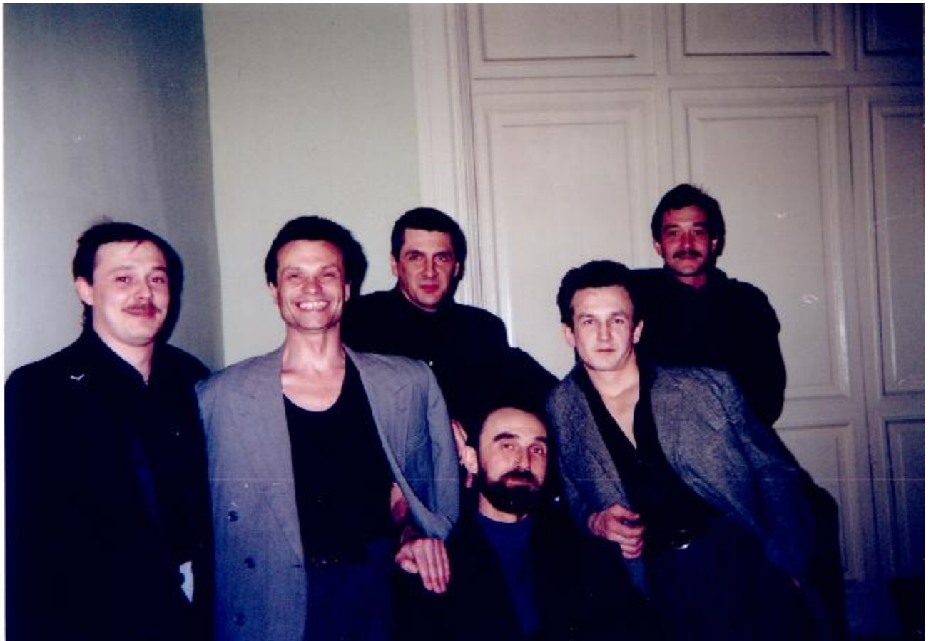
Вся группа «Лесоповал» в 1-ом составе.