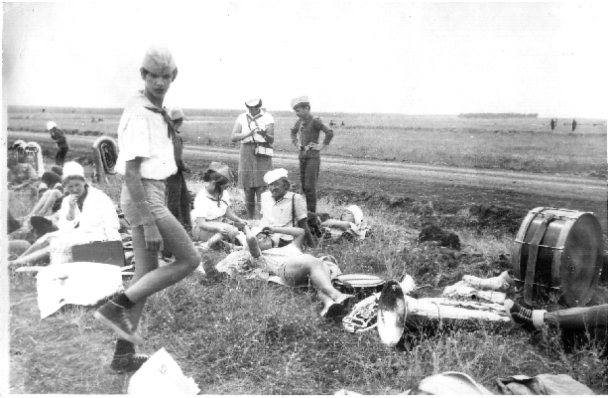
В том же пионерском лагере...