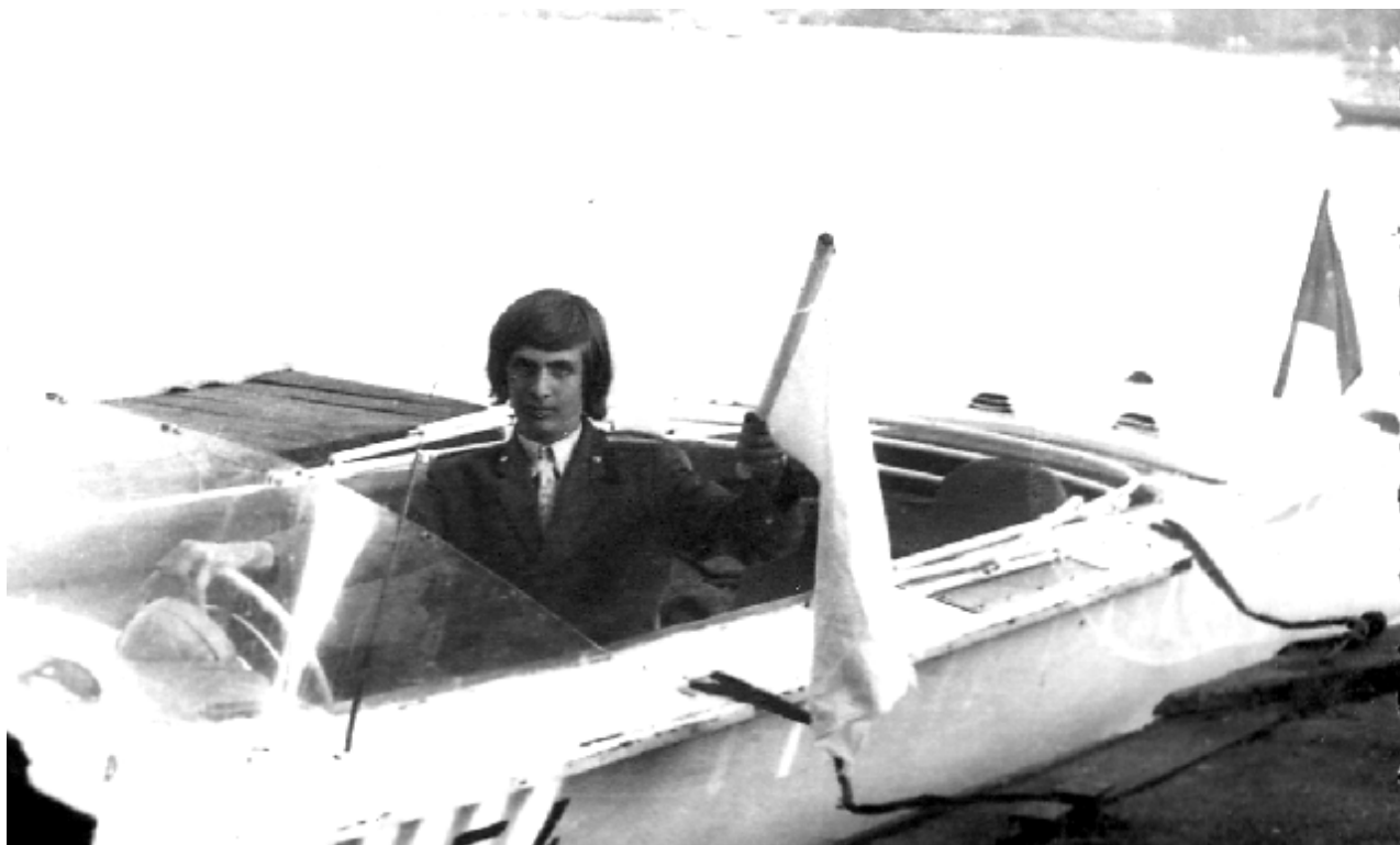
На службе в водной милиции...