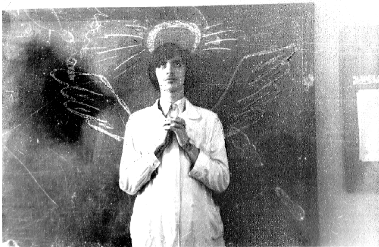
Серёжа в училище... Ангел, а не студент!